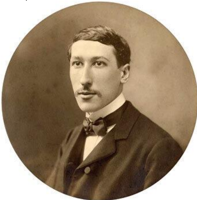
René Guénon, 1925.